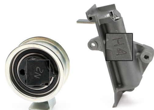
Afbeelding 2: Spanrol 531 0436 20 met trillingsdemper 533 0035 10